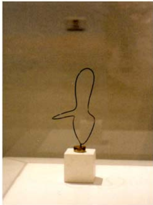
Enio Iommi (Rosario, Santa Fe, 1926) Línea Continua, 1948 Alambre, Bronce y Madera 35 x 15 x 17 cm