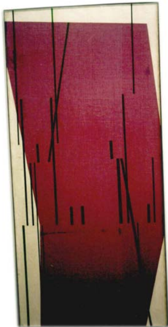
Tomás Maldonado (Buenos Aires, 1922) Una Forma y Series, 1952 Óleo sobre tela 150 x 70 cm

Estos cambios, marchas y contramarchas de los diseños nos dicen algo que excede un planteo en los términos estrictos de la lógica interna del campo, los debates diferenciadores y las “razones de ser” del Diseño. Hablan, por el contrario, de sus modos de existencia que aparecen vinculados directamente a los acontecimientos macro de nuestra historia. Historiarlos, restituyendo especificidad pero a la vez un marco comprensivo más amplio, resulta todo un desafío. Efectivamente, el dar cuenta de la dinámica interna, de los discursos que fueron sedimentando a la práctica del Diseño, como a la vez, de las razones externas que indican nortes más lejanos en sintonía con los grandes cambios sociales, culturales, económicos y políticos es todavía una tarea pendiente.