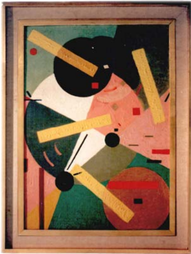
Juan Del Prete (Chieti, Italia, 1897 – Buenos Aires, 1987) Fracción con Elementos Geométricos, 1949 Óleo sobre cartón 48,5 x 68,5 cm